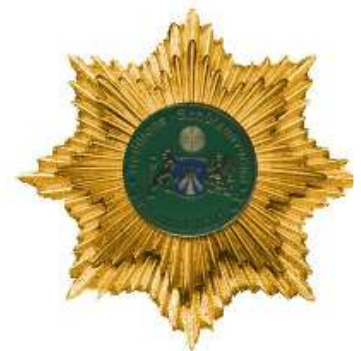
Verdienstorden in Gold