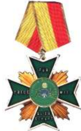
Medaille 20. jährige Mitgliedschaft