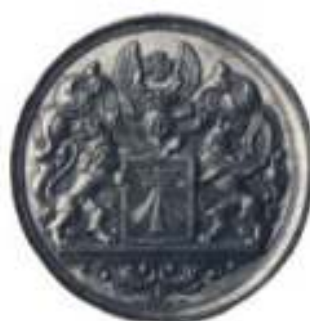
Verdienstmedaille in Silber