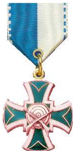
Ehrenmedaille für sportliche Leistungen in Bronze