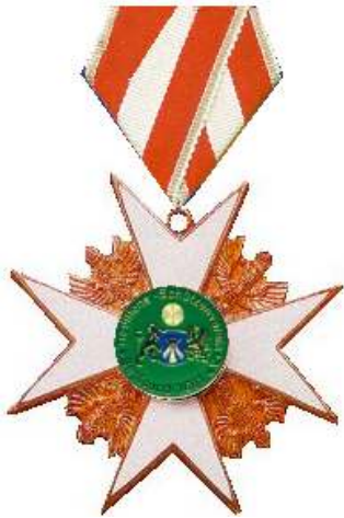
Ehrenkreuz des Vereins in Bronze