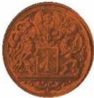
Verdienstmedaille in Bronze