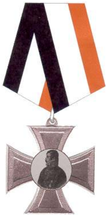
Traditionskreuz in Bronze