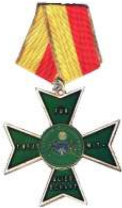
Medaille 10. jährige Mitgliedschaft