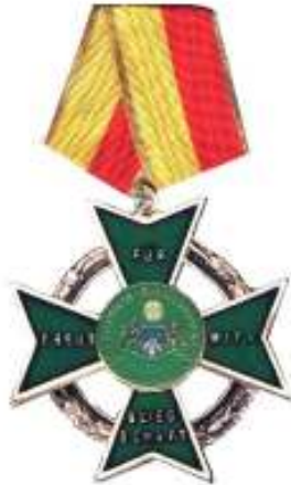
Medaille 15. Jährige Mitgliedschaft