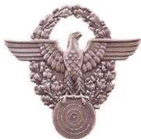
Schießsportabzeichen in Bronze