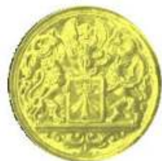
Verdienstmedaille in Gold