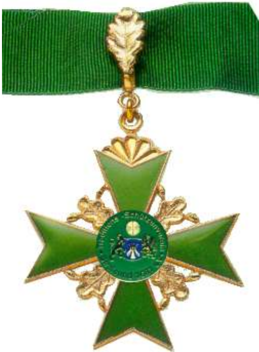
Kommandeurskreuz am Band