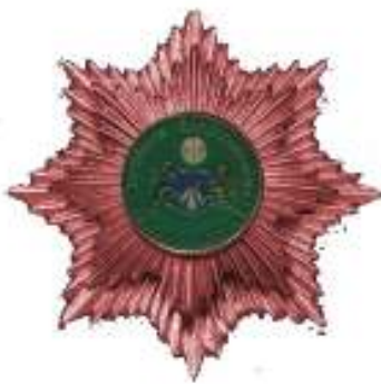
Verdienstorden in Bronze